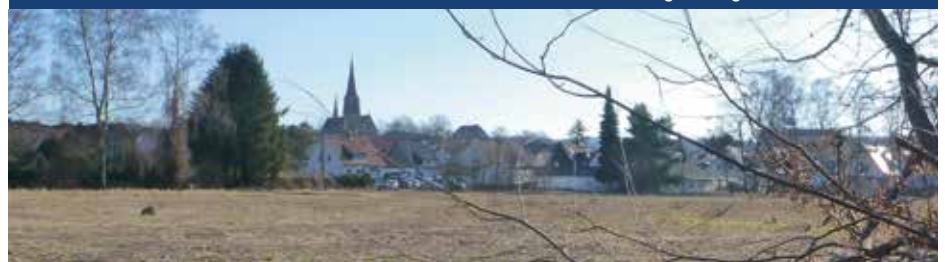
Auf diesem Grundstück entsteht das zentrumsnahe Neubaugebiet