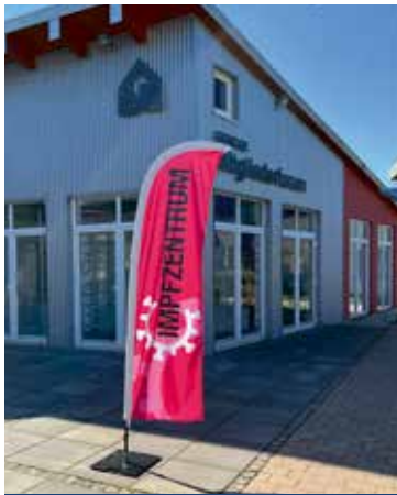
Test- und Impfzentrum im GEWOGE-Mitgliederforum