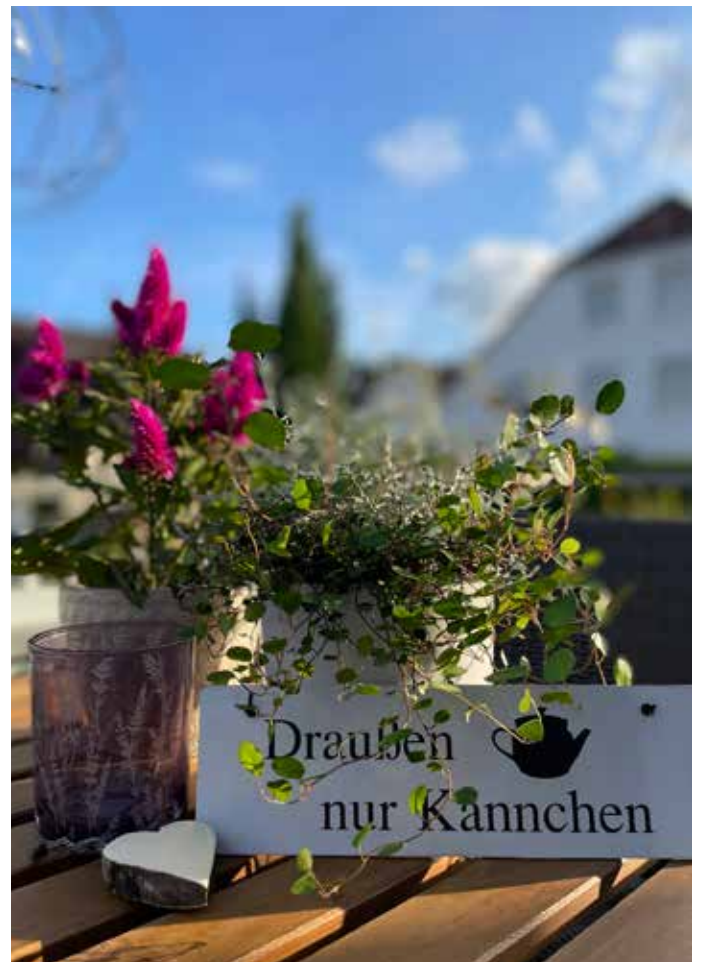
Der hübsch dekorierte Tisch lädt dazu ein Platz zu nehmen und eine Auszeit im Freien in schöner Atmosphäre zu genießen