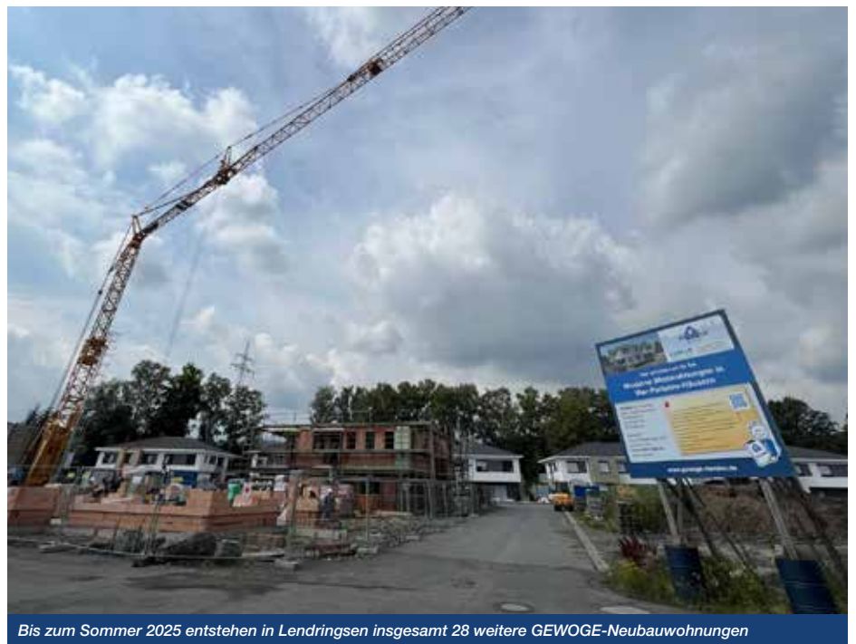
Bis zum Sommer 2025 entstehen in Lendringsen insgesamt 28 weitere GEWOG-Neubauwohnungen

Die ersten sechs Vier-Parteien-Häuser unseres Neubauprojektes in Lendringsen sind zum großen Teil fertiggestellt und bezogen. Auch wenn die Baukosten gestiegen sind, und gerade im Hochbaubereich die Bautätigkeit eher nachlässt als anzieht, haben wir uns aufgrund der weiterhin hohen Nachfrage dazu entschieden, unsere Bautätigkeit fortzusetzen. Die Bauzeit eines jeden der im neuen Bauabschnitt entstehenden sieben Häuser beträgt ca. 15 Monate, so dass die Ersteinzüge nach und nach ab Oktober 2024 geplant sind.