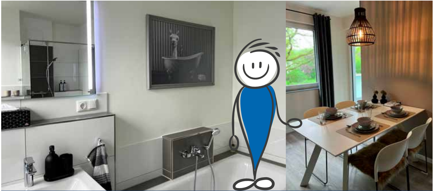
Modern und komfortabel: So präsentiert sich die neue GEWOG E-Gästewohnung

Haben Sie sich auch schon einmal gewünscht, dass Sie Übernachtungsgästen eine komfortable Bleibe ganz in der Nähe Ihrer Wohnung zur Verfügung stellen können? Sind wir einmal ehrlich: Die Wenigsten können dem Familienbesuch oder Freunden, die übers Wochenende oder zu einer Feier anreisen und eine oder mehrere Nächte bleiben, ein eigenes Gästezimmer sowie Badezimmer bieten. Selbstverständlich schränkt man sich für lieben Besuch gerne ein und rückt zusammen, aber wenn es eine bessere Lösung gibt, ist man doch froh, dass man eine komfortablere Möglichkeit anbieten kann.