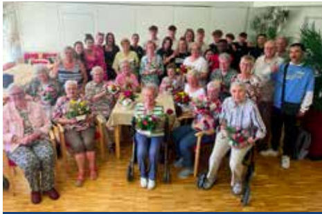
Gemeinsam verbrachten die Senioren und Schüler einen schönen Vormittag

Gleich zwei schöne Überraschungen erlebten unsere Bewohner im GEWOGÉ-Seniorenzentrum in diesem Sommer in Lendringsen.