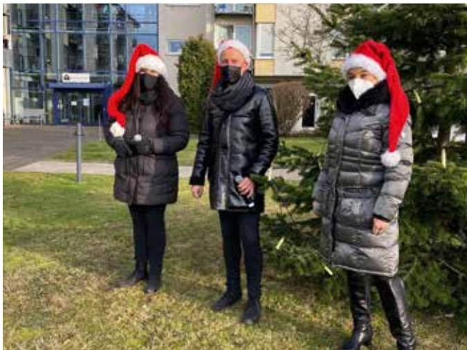
Stimmgewaltig und sympathisch: Das Gesangs-Trio begeisterte die Bewohner im GEWOGGE-Seniorenzentrum

PASSEN SIE WEITERHIN GUT AUF SICH AUF UND BLEIBEN SIE GESUND!