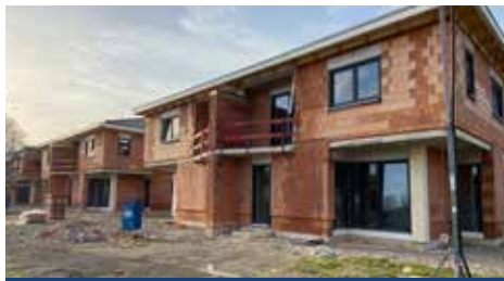
Die Fertigstellung der Doppelhaushälften wird noch in diesem Jahr erfolgen

Beim Start der Vermarktung der schlüsselfertigen Doppelhaushälften am alten Lendringser Sportplatz hätten wir nicht gedacht, dass die Neubauten innerhalb so kurzer Zeit „vergriffen“ sind. Doch die gute Lage, die attraktiven Grundrisse und die hochwertige Ausstattung der Objekte haben dazu geführt, dass wir bereits jetzt verkünden können, dass alle 5 Doppelhäuser noch in diesem Jahr zum neuen Zuhause für die die glücklichen Erwerber werden.