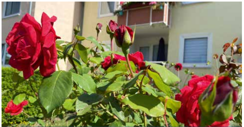
Im Tulpenweg in Menden-Lendringsen gedeihen auch Rosen prächtig

Durch bunten Blumenschmuck rund um Ihr Haus können Sie Ihre und die Stimmung der Nachbarn und Passanten in der zugegebenermaßen oftmals tristen Pandemiezeit ein wenig aufhellen. Außerdem macht es Freude, sich um die kleinen Pflänzchen zu kümmern und zuzusehen, wie sie sich im Laufe des Sommers entwickeln. Also ran die Balkonkästen, fertig, los! Füllen Sie den Anmeldecoupon aus und reichen diesen bis spätestens zum 2. Juli 2021 bei uns ein. Alternativ können Sie sich per E-Mail unter wolgast@gewoge-menden.de oder telefonisch (02373/9890-20) bei Yvonne Wolgast anmelden.