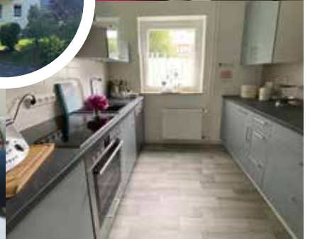
Die Bewohner dieser Wohnung am Berkenhofskamp haben ein gutes Händchen für Inneneinrichtung