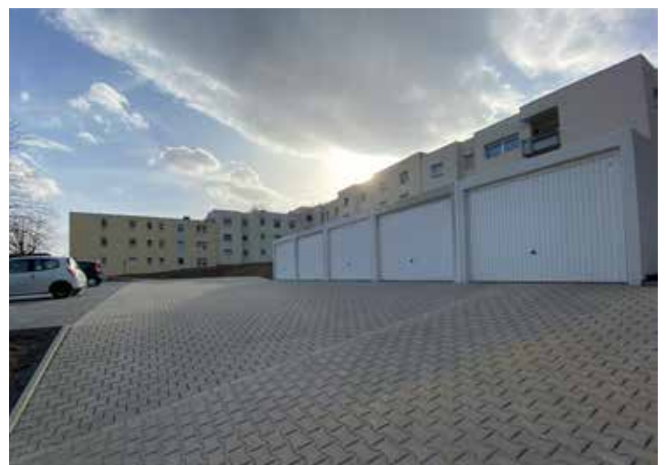
An der Overhuesstraße bietet die neu angelegte Fläche komfortable Pkw-Stellplätze und Garagen

Schon vor Fertigstellung waren alle Garagen und Stellplätze vermietet. Diese Tatsache bestätigt uns darin, auch zukünftig ähnliche Bauprojekte in unserem Bestand umzusetzen.